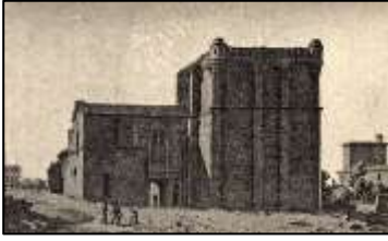
préface de Camille Jullian.